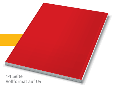
1-1 Seite Vollformat auf U4